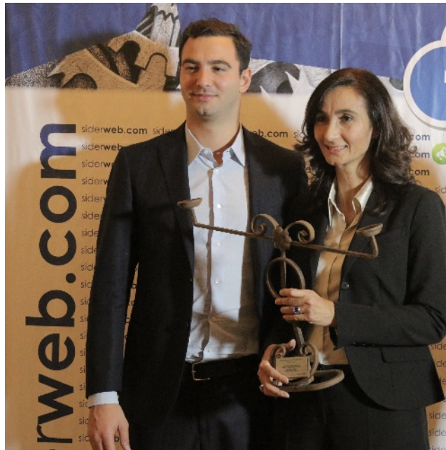
La premiazione di Forgiature Vitali srl

Forge e stampaggio a caldo - Forgiature Vitali Srl : L'azienda ha sede a Milano e dispone di un deposito a Castelli Calepio, in provincia di Bergamo. Si estende su una superficie totale di 23mila metri quadrati. Nata nel 1937, oggi produce fucinati in acciai al carbonio e legati, anelli laminati, e forgia metalli a disegno.