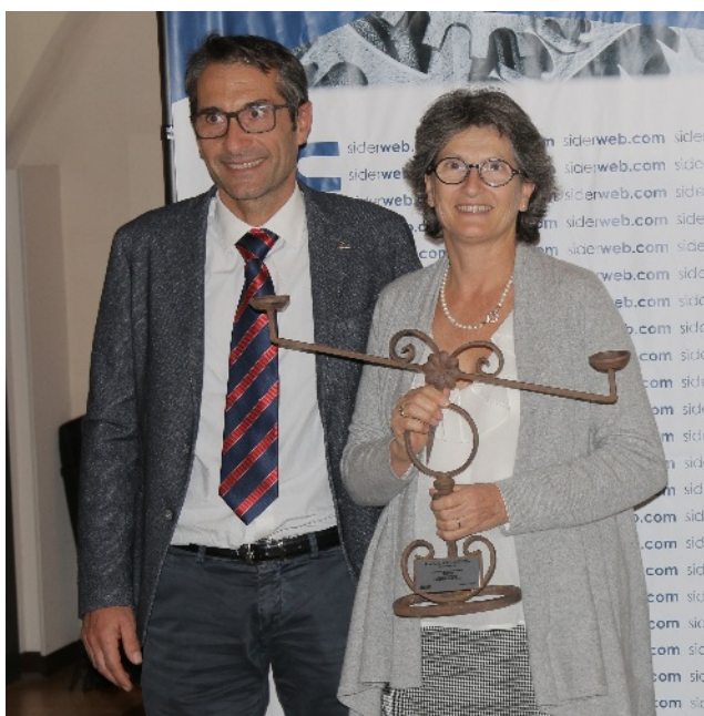
Il premio consegnato a Fonderia Augusta srl

Fonderie - Fonderia Augusta Srl : Fondata nel 1970 ad Almè, sette anni dopo l'azienda si è trasferita e stabilita a Costa di Mezzate, sempre in provincia di Bergamo. Realizza getti in acciaio e leghe speciali. Impianti e macchinari occupano un'area di oltre 8mila metri quadrati.