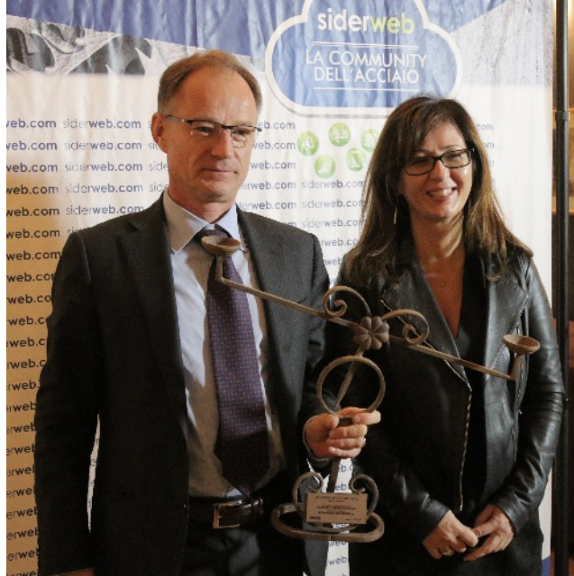
Il premio consegnato a Metallurgica Alta Brianza spa

Forge e stampaggio a caldo - Forgiature Vitali Srl : L'azienda ha sede a Milano e dispone di un deposito a Castelli Calepio, in provincia di Bergamo. Si estende su una superficie totale di 23mila metri quadrati. Nata nel 1937, oggi produce fucinati in acciai al carbonio e legati, anelli laminati, e forgia metalli a disegno.